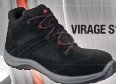
VIRAGE S1P SRC