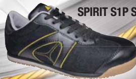
SPIRIT S1P SRC