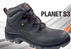
PLANET S3 SRC